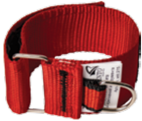
Регулируемая манжета для крепления инструмента vnt 275