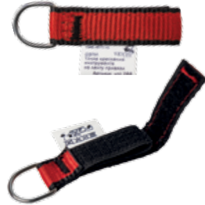
Комплект точек крепления vnt 288 set 2