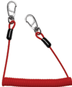
Спиралевидный привязной шнур vnt 272