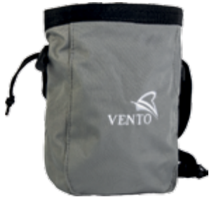
Сумка для инструмента и крепежа

Предназначены для удобства перемещения оборудования.