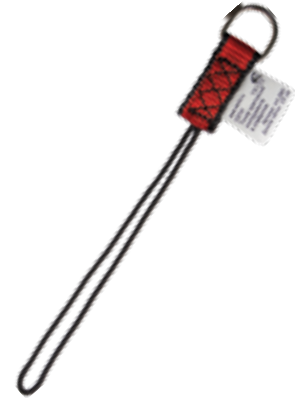
Точка крепления инструмента в отверстие vnt 290