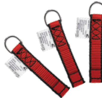
Комплект строп с кольцом vnt 276 set 3