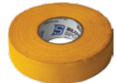
Лента липкая vnt 282