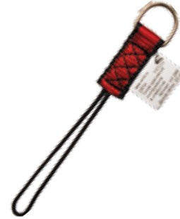
Точка крепления инструмента в отверстие vnt 289