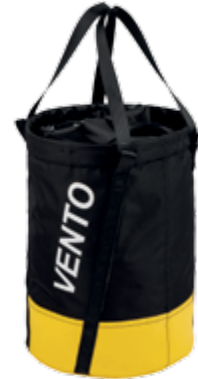
Сумка «Торба» Bucket bag